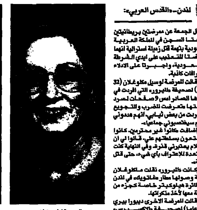
ديورا بيدي تحثت للتفكير في بي سي